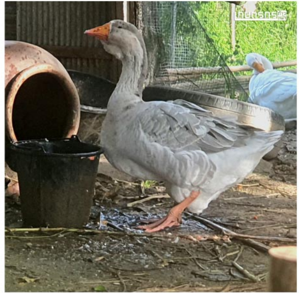
ห่านพันธุ์ผสมใจแอนท์ (Giant Dewlap Toulouse) สี Blue

ในส่วนของโรงเรือนหรือเล้าห่าน คุณเชษฐาจะใช้พื้นที่ประมาณ 10 ตรว./เล้า โดย 1 เล้า สามารถจุได้ประมาณ 10-20 ตัว โดยมีการแยกสีและสายพันธุ์ไม่ให้ปนกัน นอกจากนี้ยังมีการนำตะแกรงกั้นและใช้อวนเก่ามาล้อมคอกไว้อีกชั้นหนึ่ง เพื่อป้องกันศัตรูทางธรรมชาติของห่าน อาทิ งูเห่าและตัวเงินตัวทองอีกด้วย