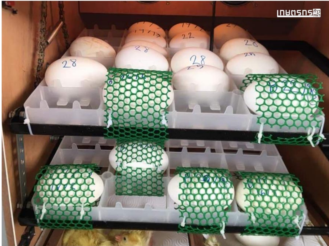
ไข่ฟักในเครื่องฟักไข่