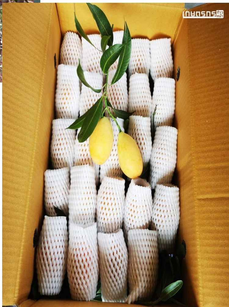
การแพ็คเตรียมส่ง