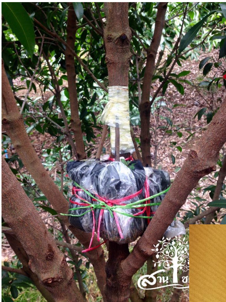
ตุ้มทาบกิ่ง