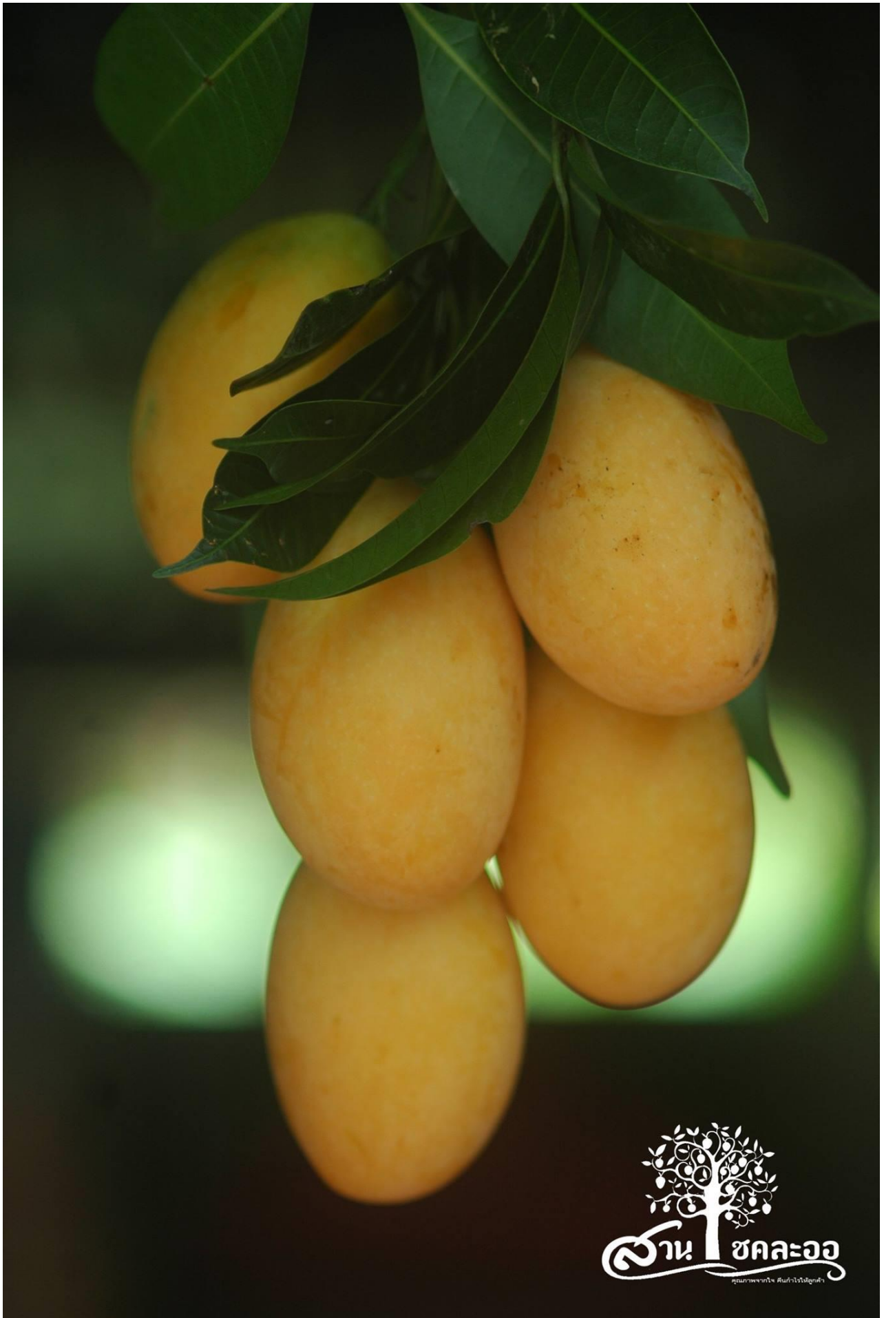
มะปรางหวานสุวรรณบาตร