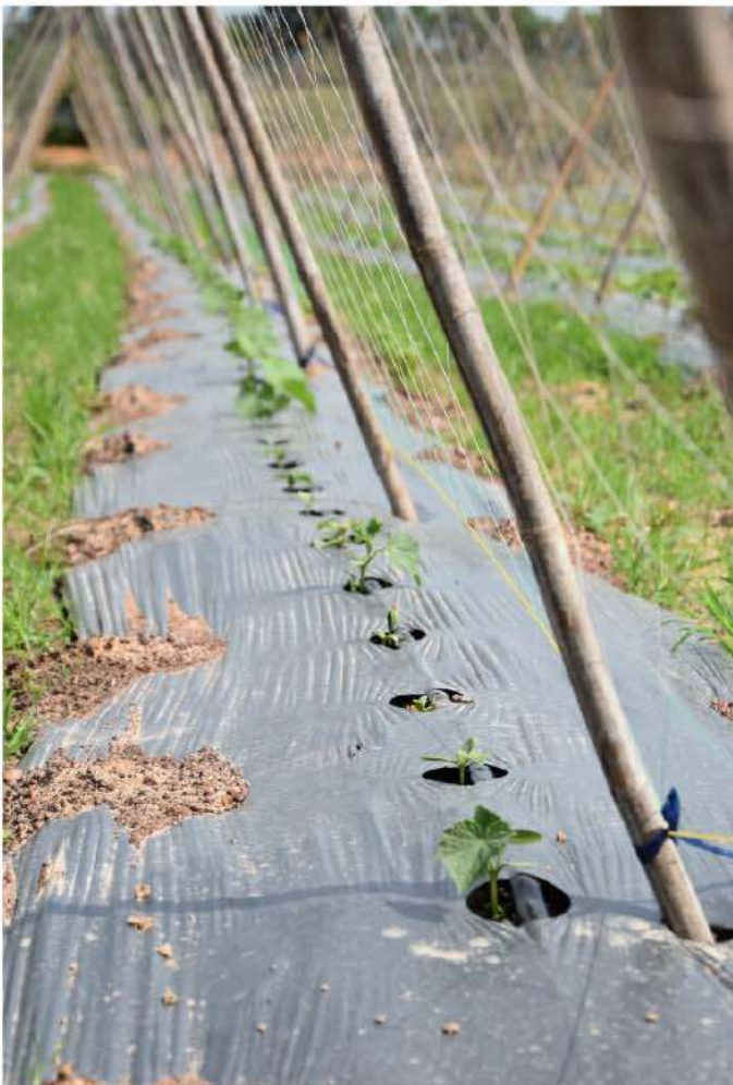
แตงร้าน “ระยะหลังย้ายปลูก 7 วัน เริ่มแตกใบอ่อน”

โดยในระยะนี้ คุณสุพัฒน์ จะปรับปริมาณการให้ปุ๋ยตรากระต่าย สูตร 16-16-16 บลู ตามความสมบูรณ์ของต้นและผลเป็นหลัก โดยยึดปริมาณคร่าวๆ ที่จำนวน 3 กิโลกรัม/น้ำ 200 ลิตร/ไร่ ความถี่วันเว้นวัน วันละ 2 ครั้ง แต่หากช่วงไหนผลแตงร้านเริ่มคด หรือมีผิวกร้าน จะต้องเร่งบำรุงเป็นพิเศษ สิ่งเหล่านี้เกษตรกรต้องมีความละเอียดและใส่ใจอยู่เสมอ