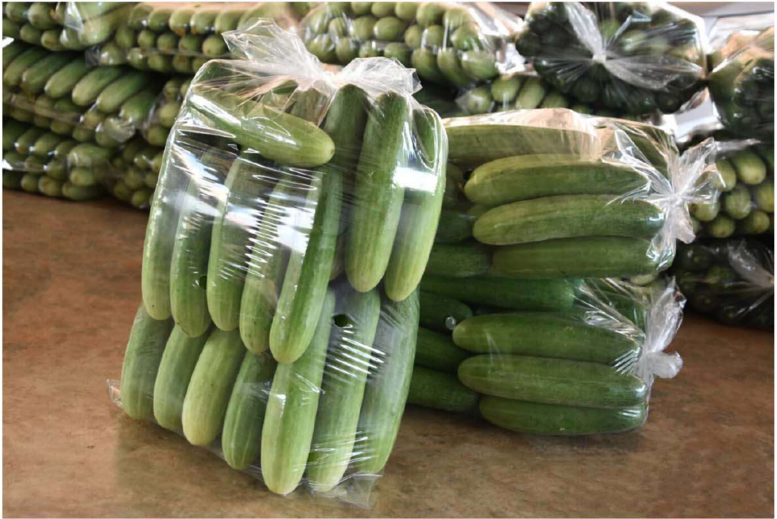
แตงร้านเบอร์เอ ผลสีเขียวเข้ม ทรงกระบอกกรอกถุงง่าย เป็นที่ต้องการของตลาด