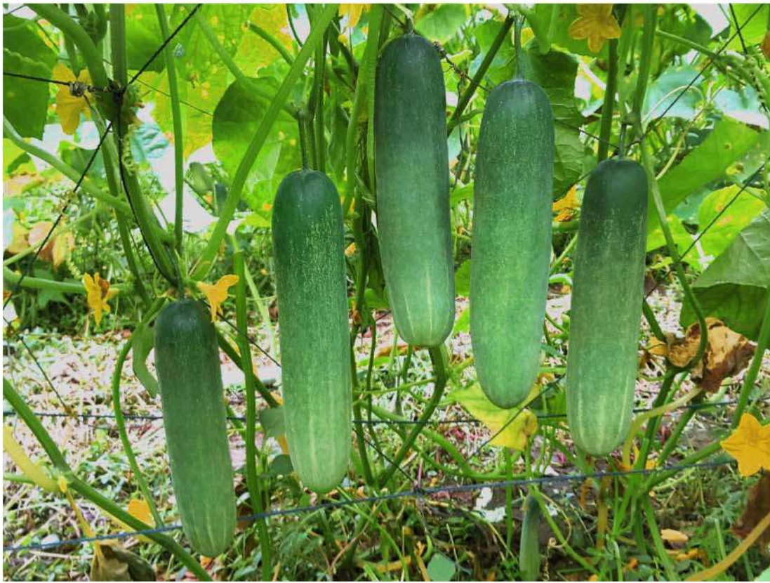
แตงร้านในระยะพร้อมเก็บเกี่ยว ผลตรงยาวประมาณ 18-22 เซนติเมตร ไม่คดงอ ผลลัพท์จากการบำรุงอย่างสม่ำเสมอ

“เราต้องหมั่นสังเกต...เพราะแตงร้านเป็นพืชที่เจริญเติบโตเร็ว ในทุกๆ วันจะเห็นความเปลี่ยนแปลงของผลที่โตขึ้น หากพบว่าผลที่ได้เหี่ยว งอ หรือมีผิวกร้าน แสดงว่าปุ๋ยและน้ำที่ให้ไปไม่เพียงพอต่อการนำไปใช้ของแตงร้าน ดังนั้นในช่วงติดดอกและติดผลผลิตแล้ว ควรค่อยๆ เพิ่มอัตราการให้ปุ๋ยผสมน้ำอย่างเหมาะสม”