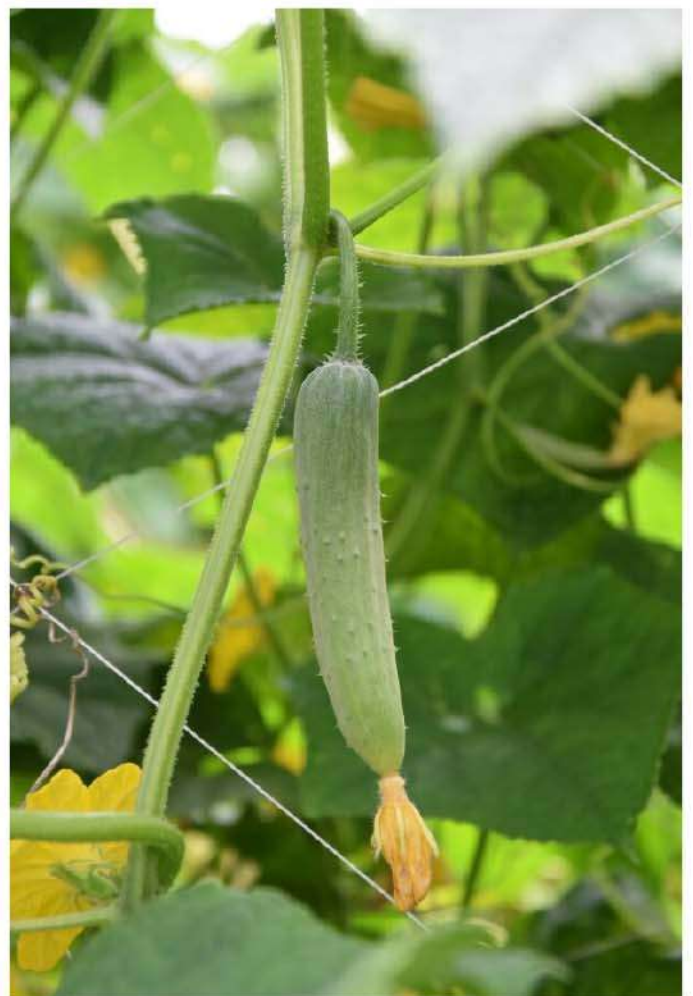
แตงร้าน “ระยะติดดอก-เริ่มเห็นผลเล็ก”