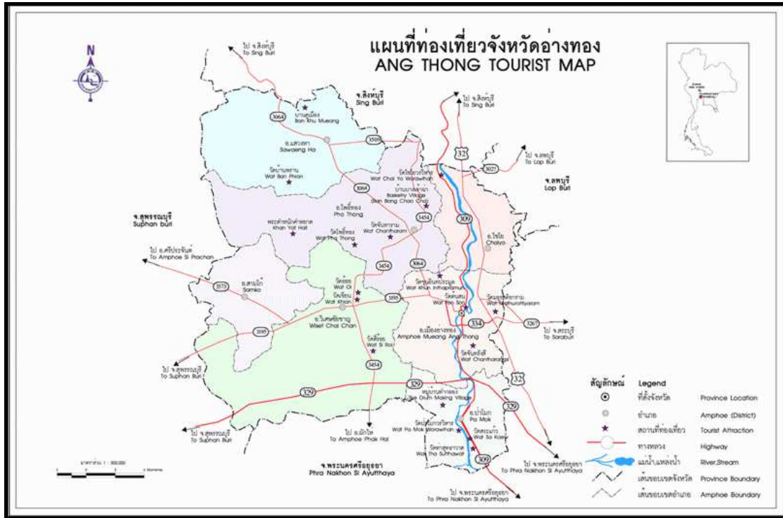
ภาพที่ 2.1 แผนที่จังหวัดอ่างทอง