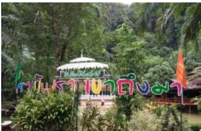
ชุมชนท่องเที่ยวเกษตรอินทรีย์บนวิถีภูมิปัญญาท้องถิ่น : บรบิบ้านถ้ำเสือ

ระดับสาขาอำเภอ ระดับสำนักงานจังหวัดกระบี่ ฝ่ายภาคใต้ตอนบน ที่จังหวัดสุราษฎร์ รวมถึง ฅ.ก.ส.สำนักงานใหญ่ เพื่อให้ไปสู่เป้าหมายการสร้างผู้ประกอบการใหม่ ซึ่งชุมชนบ้านถ้ำเสือมีความต้องการพัฒนาตนเอง โดยเริ่มต้นจากการสร้างธุรกิจไร่ปรีดาโฮมสเตย์ ให้แข็งแรงก่อน ชุมชนก็จะได้รับผลกระทบเชิงบวกไปด้วยจากการเข้ามามีส่วนร่วมพัฒนาชุมชนบ้านถ้ำเสือของ ฅ.ก.ส. ที่ได้เข้ามาทั้ง 4 ระดับ ด้วยวิสัยทัศน์การมองเห็นถึงความพร้อมของชุมชน เล็งเห็นศักยภาพต้นทุนที่มีพร้อมในทุกด้าน คนในชุมชนบ้านถ้ำเสือพร้อมรับการพัฒนา อีกทั้งชุมชนเข้าใจ SWOT รู้ตัวตนของตนเอง เมื่อทาง ฅ.ก.ส. ได้ก้าวเข้ามา จึงเป็นก้าวแห่งการเกื้อหนุนสอดรับกับทางชุมชนที่พร้อมจะก้าวเดินร่วมกัน เป็นช่วงเวลาที่เหมาะสมชุมชนได้เปิดรับโอกาสนั้น ถือได้ว่าทาง ฅ.ก.ส. ได้เข้ามาถูกที่ถูกเวลา ทั้งหยิบยื่นโอกาสและช่วยลดต้นทุนในเรื่องดอกเบี้ยเงินกู้ ช่วยเสริมสร้างธุรกิจชุมชนให้แข็งแรงได้อย่างดี”