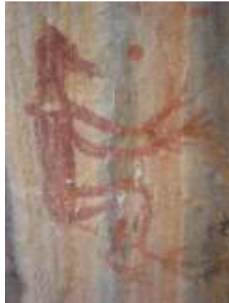
ภาพเขียนสีที่เขากาโรส

หมู่บ้านถ้ำเสือ หมู่ที่ 5 ตำบลอ่าวลึกใต้ อำเภออ่าวลึก จังหวัดกระบี่ ตั้งอยู่ทางตอนเหนือของจังหวัดกระบี่ มีอาณาเขตติดต่อกับฝั่งอันดามันที่ดินคลองน้ำเค็มปันแดน สภาพพื้นที่ป่าชายเลนภูเขาหินปูนลูกโดดกระจายอยู่ในพื้นที่หมู่บ้าน ประกอบด้วยโถงถ้ำ ภูเขา และหลักฐานการมีอยู่ของมนุษย์ก่อนประวัติศาสตร์ พบซากกระดูกมนุษย์ เครื่องปั้นดินเผามากมาย เป็นแหล่งโบราณคดีที่สำคัญอย่างหนึ่งของอ่าวลึก เชื่อว่าเคยเป็นที่อยู่ของมนุษย์ถ้ำยุคก่อนประวัติศาสตร์ที่มีความเกี่ยวพันกับกองกระดูกมากมาย ภาพเขียนสีที่ถ้ำผีหัวโต มีความเชื่อว่า เป็นถ้ำสุสานของมนุษย์ยุคก่อนประวัติศาสตร์ที่มีความเชื่อคล้ายคลึงกับชาวอียิปต์โบราณ