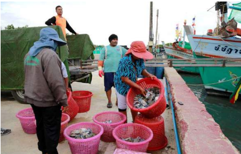
เรือประมงปูม้าเข้าเทียบท่านำปูม้าสดๆ มาส่งให้แม่ค้านำไปขาย

จากการดำเนินงานของกลุ่มธนาคารปูม้าในการเพาะฟักพันธุ์ปูม้าที่ได้รับความร่วมมือด้วยดีจากสมาชิก ทำให้วันนี้ชาวบ้านดอนในที่ทำประมงชายฝั่งสามารถจับปูม้าได้เฉลี่ยรอบละไม่ต่ำกว่า 50 กิโลกรัม ซึ่งเพิ่มขึ้นจากเมื่อก่อนเป็นจำนวนมาก จากการบอกเล่าของสมาชิกในกลุ่มธนาคารปูม้าว่าเมื่อก่อนชาวบ้านจับปูได้เฉลี่ยรอบละ 7- 8 กิโลกรัมเท่านั้น และเริ่มหาปูยากขึ้นเรื่อยๆ แต่พอมีธนาคารปูม้าขึ้นมา ก็มีปูให้จับได้ทุกวัน นับเป็นความสำเร็จที่น่าภาคภูมิใจของกรดำเนินงานธนาคารปูม้าบ้านดอนในแห่งนี้ ทำให้ทุกวันนี้ปูม้าที่ชาวประมงชายฝั่งบ้านดอนในจับได้เป็นที่ต้องการของตลาดเป็นอย่างมาก ส่งผลให้ชาวบ้านหันมาทำประมงปูม้าเพิ่มขึ้น