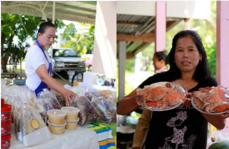
อาหารทะเลแห้งและปูม้าสัญลักษณ์ความอร่อยของบ้านดอนใน