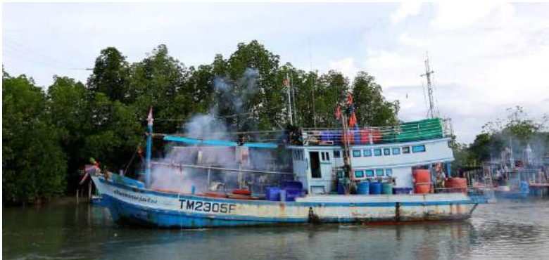
เรือประมงกำลังออกจากท่ามีการจุดประทัดเอาฤกษ์เอาชัย

ในปี 2560 วิสาหกิจชุมชนกลุ่มแพปลาชุมชน ตำบลแหลม ผักเบี้ย อำเภอบ้านแหลม จังหวัดเพชรบุรี ได้รับรางวัลรองชนะเลิศ อันดับที่ 1 วิสาหกิจชุมชนดีเด่นระดับเขต ซึ่งเป็นเพียงตัวอย่างหนึ่ง ของวิสาหกิจชุมชนที่ประสบผลสำเร็จ จากการร่วมแรงร่วมใจกันของ คนในชุมชน นำไปสู่ชุมชนที่เข้มแข็งสร้างงานสร้างรายได้