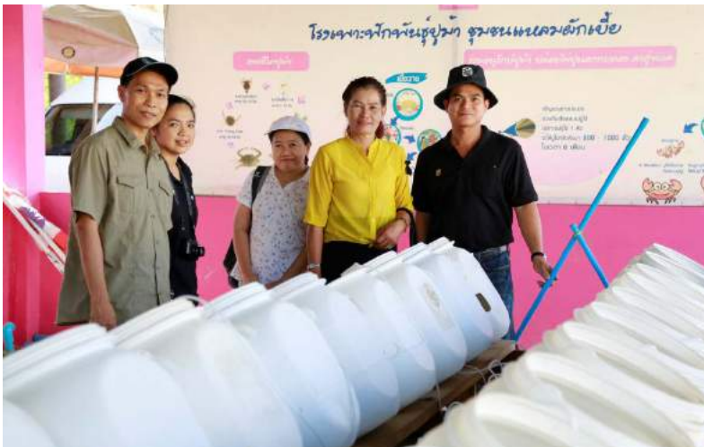
โรงเรือนและอุปกรณ์สำหรับเพาะฟักพันธุ์ปูม้าก่อนปล่อยคืนสู่ทะเล

ปัจจุบันกลุ่มมีวิธีการเพาะเลี้ยงปูม้าบนฝั่ง โดยทำโรงเรือนในการเพาะเลี้ยงอย่างเหมาะสม ซึ่งได้รับความร่วมมือจากสมาชิกในกลุ่ม และการส่งเสริมสนับสนุนจากหน่วยงานภายนอกทั้งภาครัฐและเอกชน โดยชาวประมงที่จับปูม้าที่มีไข่นอกกระดองมาได้ ก็จะนำมาให้ที่ศูนย์เพาะเลี้ยงนี้ เมื่อไขกลายเป็นลูกปูที่สามารถปล่อยสู่ทะเลได้แล้ว ศูนย์เพาะเลี้ยงก็จะคืนแม่ปูให้กับชาวประมงเพื่อนำไปขายต่อไป ศูนย์เพาะเลี้ยงปูม้าแห่งนี้ได้ปล่อยลูกปูม้ากลับคืนสู่ทะเลทุกวัน ประมาณวันละ 1 แสนตัว ซึ่งในบางครั้งสมาชิกก็จะไม่ขอรับคืนปูม้า แต่ยกให้กลุ่มนำไปขายเพื่อนำรายได้เข้ากลุ่มและเป็นทุนสำหรับค่าใช้จ่ายในการบริหารกลุ่มต่อไป