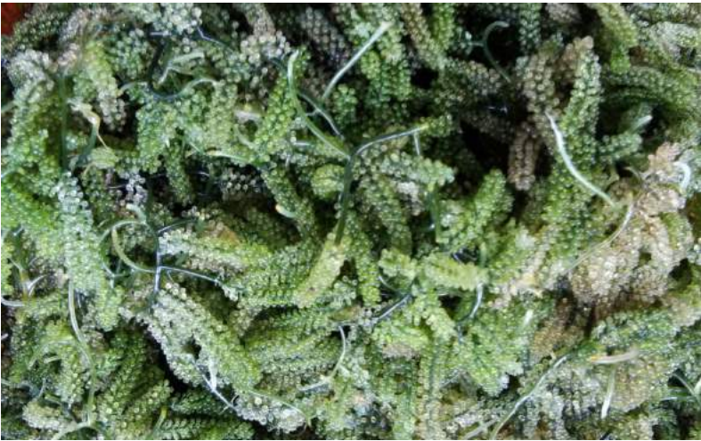
สาหร่ายพวงองุ่นที่สมบูรณ์พร้อมเก็บขาย ปลูกที่ระดับความลึกประมาณ 1 เมตร และความเค็มของน้ำทะเลอยู่ในช่วง 28 ถึง 30 ดีกรี