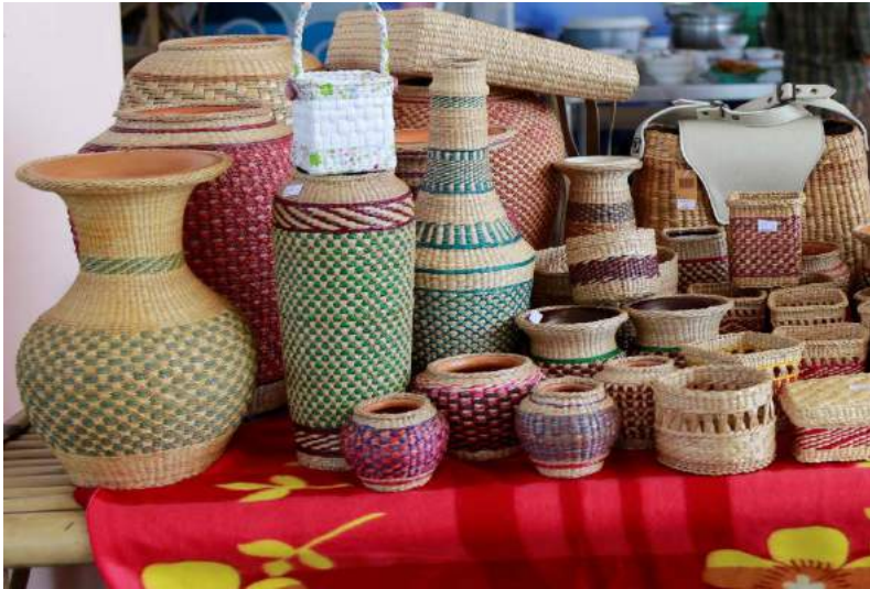
ผลิตภัณฑ์จักสานจากต้นรูปถั่ว