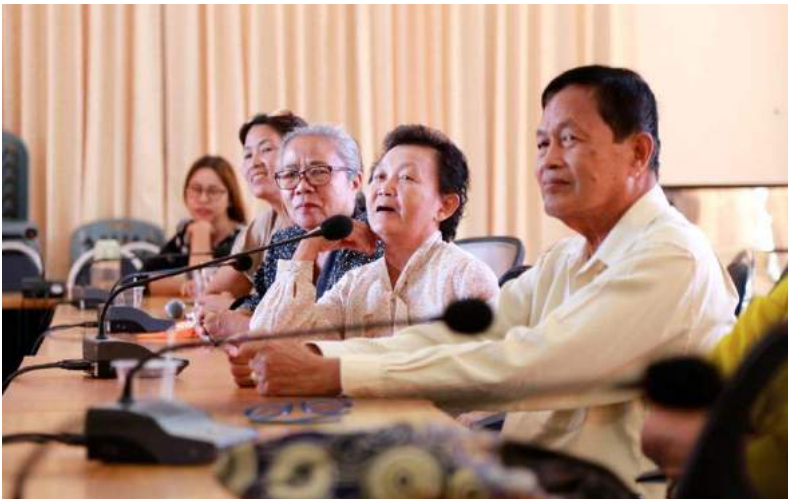
กลุ่มแกนนำบ้านดอนใน หมู่ 2 ไซเวทที่พูดคุยสร้างความเข้าใจ

การศึกษาดูงานทำให้เห็นรูปแบบแนวคิด และแนวทางการปฏิบัติที่เกิดจากการลงมือทำ ซึ่งเป็นภูมิปัญญาปฏิบัติที่สามารถนำมาปรับใช้กับกระบวนการทำงานให้เหมาะสมกับบริบทชุมชนบ้านดอนใน ซึ่งทุกคนที่ไปดูงานจะเก็บความรู้ต่าง ๆ ที่ตนได้พบเห็น นำกลับมาแลกเปลี่ยนเรียนรู้กันทันที เพื่อให้เกิดการแลกเปลี่ยนข้อมูลและการแบ่งปันข้อมูลเพื่อให้ทุกคนได้รับรู้รับทราบเหมือนกัน ในขณะที่เดียวกันก็เป็นการตรวจเช็คข้อมูลที่ได้มาอีกครั้งว่ามีความเป็นจริงมากน้อยเพียงใด ซึ่งสมาชิกจะช่วยกันแสดงความคิดเห็น และออกแบบการนำองค์ความรู้เหล่านั้นมาปรับใช้ให้เกิดประโยชน์กับชุมชนบ้านดอนใน ที่เน้นการต่อยอดพัฒนาจากต้นทุนเดิมที่มีอยู่ เพราะถือเป็นจุดแข็งของหมู่บ้าน