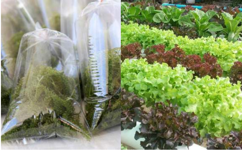
สำหรับพวงองุ่นและผักไฮโดรโปนิกส์สดจากฟาร์มฐานเรียนรู้