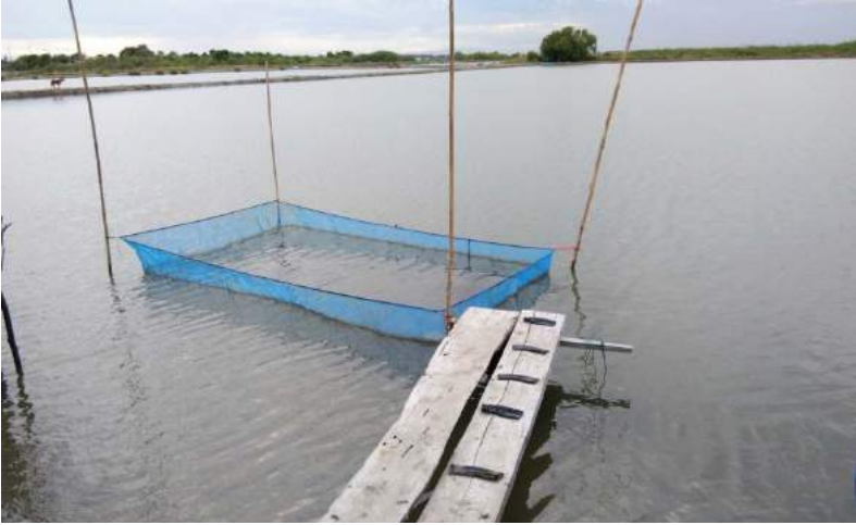
การเตรียมพื้นที่โดยปรับสภาพจากนาเกลือมาเป็นฟาร์มสาหร่าย