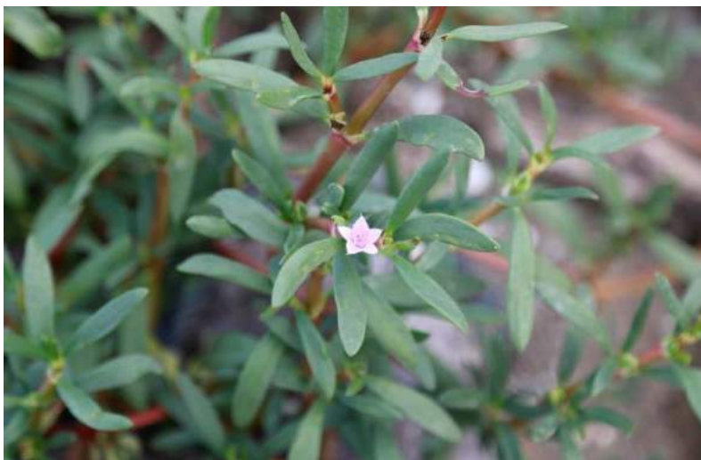
ผักเบี้ยพืชพื้นถิ่นที่พบได้ทั่วไปที่บ้านดอนใน

บ้านดอนใน ตั้งอยู่ในตำบลแหลมผักเบี้ย อยู่ห่างจากตัวเมืองเพชรบุรีประมาณ 20 กิโลเมตร มีพื้นที่ทั้งหมดประมาณ 2,764 ไร่ เป็นพื้นที่ทำนาเกลือ ประมาณ 400 ไร่ มีจำนวนครัวเรือน 110 ครัวเรือน ประชากรตามทะเบียนราษฎร 350 คน บ้านดอนใน เป็นชื่อเรียกกันมานานหลายชั่วอายุคนแล้วไม่สามารถหาชื่อผู้ตั้งชื่อหมู่บ้านได้ เพียงแต่รู้ว่าตำบลแหลมผักเบี้ยนั้น มีอยู่สามดอน คือ ดอนนอก ดอนกลาง และดอนใน ซึ่งบ้านดอนในเป็น หมู่บ้านเล็กๆ ที่ตั้งอยู่บนที่ดอนสูงด้านใน น้ำทะเลท่วมไม่ถึงบนดอน ชาวบ้านนิยมปลูกต้นมะพร้าว ในขณะที่เดียวกันพื้นที่ชายดอนด้านล่างมีพืชล้มลุกชนิดหนึ่งที่สามารถเติบโตได้ดีในพื้นที่ดังกล่าว นั่นคือต้น “ผักเบี้ย”