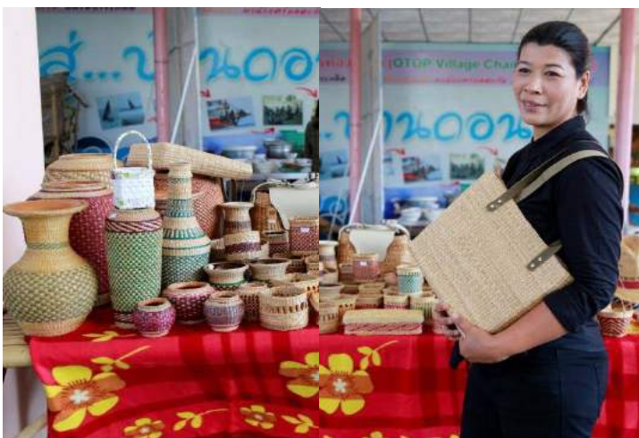
กระเป๋าและผลิตภัณฑ์จักสานจากรูปถาผี

การท่องเที่ยวชุมชนบ้านดอนโนใต้เชื่อมโยงเครือข่ายการท่องเที่ยวทั้งภายในและภายนอกที่มีเส้นทางท่องเที่ยวอยู่แล้ว ซึ่งนักท่องเที่ยวส่วนใหญ่เมื่อเข้ามาท่องเที่ยวในชุมชนทั้งรูปแบบของการศึกษาดูงาน การฝึกอบรมตามโครงการของ ธ.ก.ส. และมาเที่ยวชมเป็นการส่วนตัว ล้วนเป็นโอกาสในการสร้างรายได้ให้ชุมชนทั้งสิ้น ชาวบ้านจึงรวมตัวกันสร้างผลิตภัณฑ์ชุมชนขึ้นมาเพื่อขายให้นักท่องเที่ยว โดยรวบรวมจากกลุ่มอาชีพต่างๆ มีทั้งอาหารสด อาหารทะเลแห้ง ของใช้จากรูปถาผี สาหร่ายพวงองุ่น ผักไฮโดรโปนิิกส์ รวมทั้งปมู้าซึ่งเป็นของขึ้นชื่อของบ้านดอนโนและเป็นจุดดึงดูดนักท่องเที่ยวเข้ามาเยี่ยมชมอย่างไม่ขาดสาย