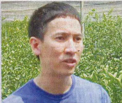
โครงการสินเชื่อ 1 ตำบล 1 SME เกษ

นอกจากนั้นทางแบรนด์ Lemon Me ได้มีการเตรียมทำคอนแทคฟาร์มมิ่ง (Contract Farming) หรือการทำให้เกษตรกรในพื้นที่มาซื้อต้นพันธุ์มะนาวที่ทางแบรนด์มีอยู่