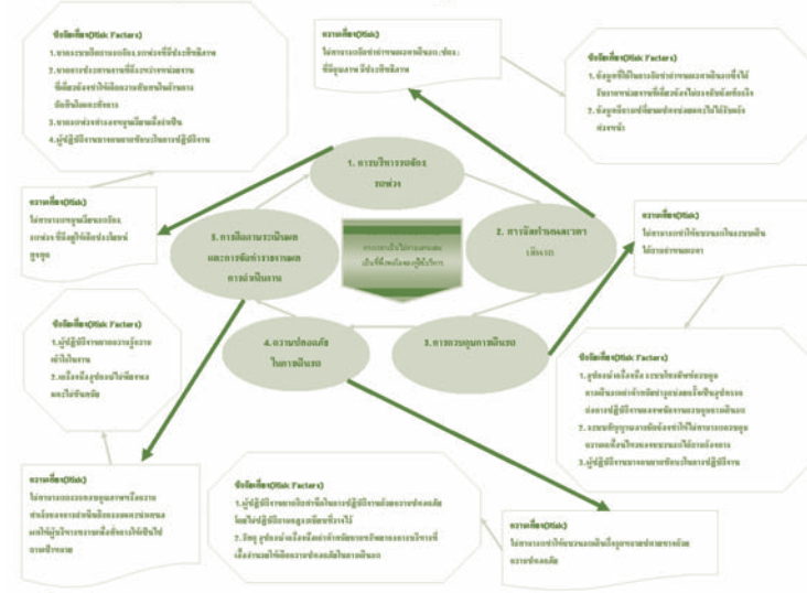
รูปแบบของความถี่ในกระบวนการปฏิบัติ (Risk Map)

ประการที่สอง หลักภูมิคุ้มกัน นี้คือหลักในการบริหารความเสี่ยงนั่นเอง การบริหารความเสี่ยงเป็นเรื่องที่จะต้องทำทั้งองค์กร ถ้ามีการบริหารความเสี่ยงในหน่วยงานต่างๆ รวมกันแล้ว ก็จะทำให้ทั้งองค์กรดูแลความเสี่ยงได้ เปรียบเสมือน