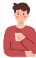
ของรางวัล