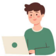
รู้สึกถึงความหมาย ในการทำงาน