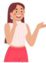
ได้รับคำชื่นชม