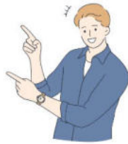
ความท้าทาย