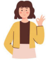
ทำเพื่อสังคม