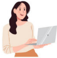
ความก้าวหน้า