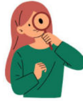
ความแปลกใหม่