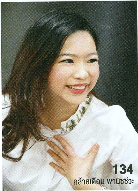
134 คล้ายเดือน พาณิชชีวะ