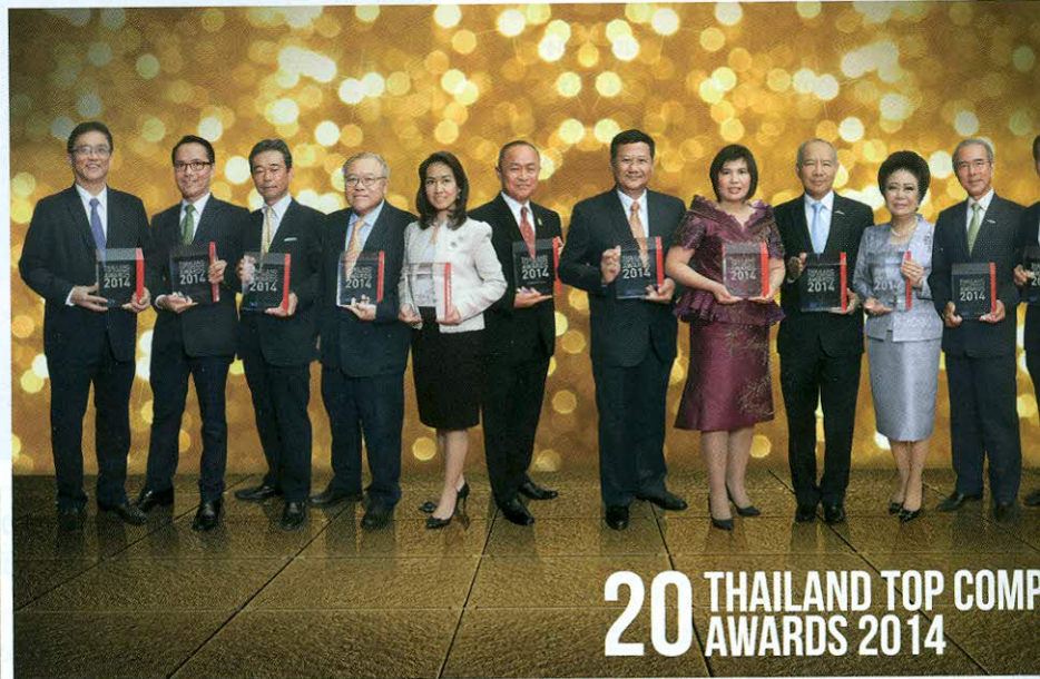
20 THAILAND TOP COMPANY AWARDS 2014

80 น้องใหม่ ดิโอสดกฯ ผุด Library Houze รุกฝั่งธนฯ 82 แสนสิริวาดฝันปี 57 รายได้แตะ 34,000 ล้านบาท