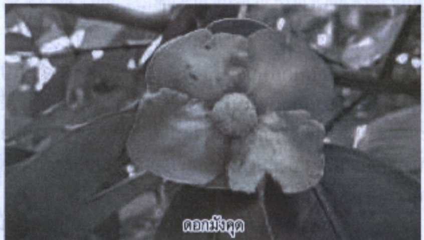
ดอกมังคุด

สำหรับการใส่ปุ๋ยทุกครั้งจะต้องวัดรอบทรงพุ่มของมังคุด ด้วย คือ ถ้าทรงพุ่มมีขนาด 3 เมตร ให้เราใส่ปุ๋ย 1 กิโลกรัม หรือเทียบได้ คือ 3 : 1 ให้เราหว่านให้รอบทรงพุ่มห่างจาก ต้น 1 เมตร