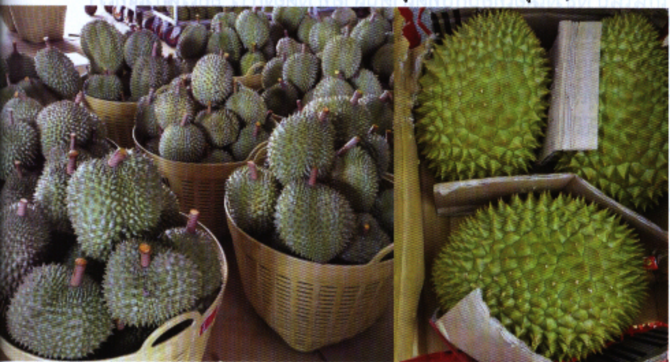
▲ การส่งออกทูเรียนเวียดนาม

ไปอินโดนีเซียมีข้อจำกัดแต่ยังคงเป็นตลาดที่สามารถรองรับได้ในระดับหนึ่ง นอกจากนี้ทุเรียนไทยยังมีพันธุ์ที่หลากหลายให้เลือกทั้งพันธุ์ดั้งเดิมและพันธุ์ที่มีการพัฒนาขึ้นมาใหม่ๆ การปลูกพันธุ์ที่หลากหลายจะช่วยให้มีการกระจายช่วงการผลิตและเป็นทางเลือกของผู้บริโภคทั้งในและต่างประเทศได้มากขึ้น