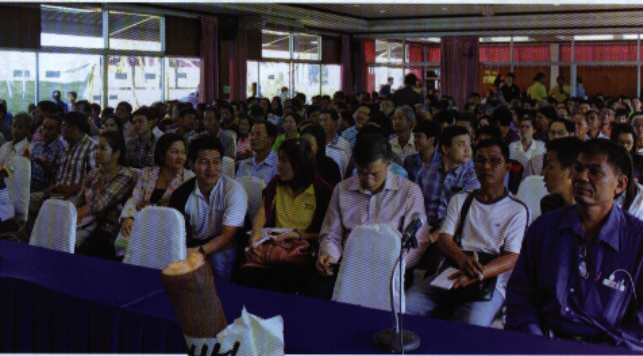
▲ บรรยากาศผู้ฟังเสวนาเต็มห้อง