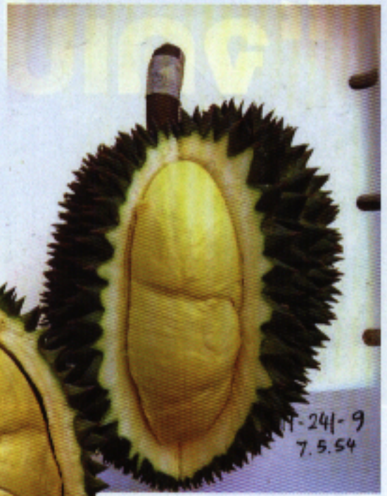
◀ ▲ พันธุ์ทุเรียนจันทบุรี 6