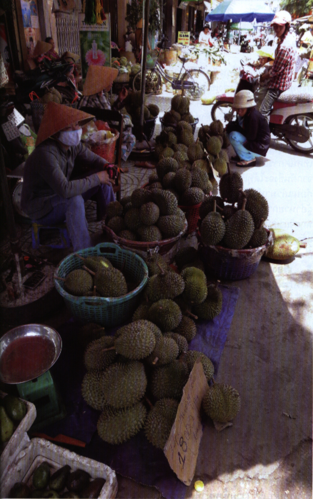
▲ ทูเรียนพื้นเมืองพันธุ์ต่าง ๆ ของเวียดนาม